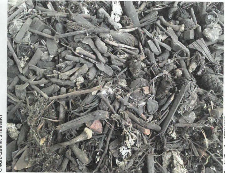
Gereinigtes Strukturmaterial Gereinigtes Strukturmaterial

also restricted by the Fertilizer Ordinance. The entire materials cycle is threatened if a company is unable to adhere to the quality criteria and standards for compost because the organic waste it is supplied with contains too many impurities that prevent the operator from achieving the required purity level. To address this situation, processing companies are working together with the sorting specialist STEINERT on one of the many components of a comprehensive solution. Among other things, the UniSort Black ejects foreign particles out of the structural material and creates a pure intermediate product.