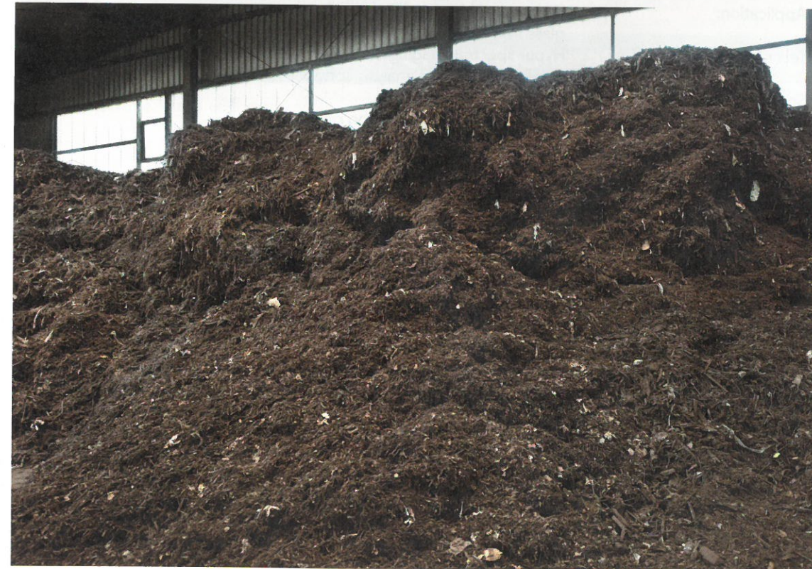
Intermediate product Zwischenprodukt

stoffe – inklusive aller dunkel gefärbten und schwarzen Kunststoffe – restliche Folien und Metalle, zu separieren. Insgesamt reinigen die Technologien mehr als 98 % aller Fremdstoffe ab. Darüber hinaus können mit der Technologie Glasbruch, Steine und Keramik erfasst werden.