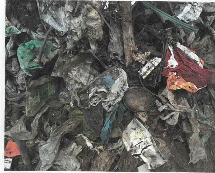
Foreign particles sized 10 – 250 mm Fremdstoffe 10 – 250 mm