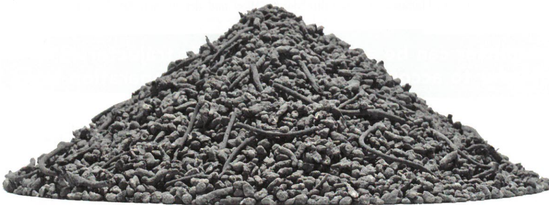
◀ Incineration bottom ash 0–8 mm output