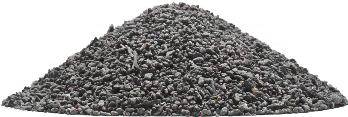
◀ Incineration bottom ash 0–8 mm input